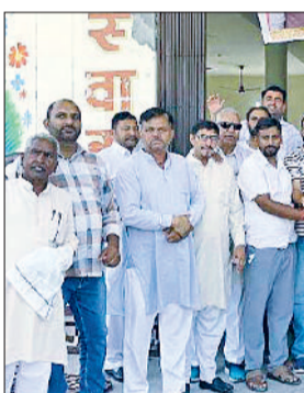
करनाल। रवतदान शिविर में विधायक का स्वागत करते आयोजक।