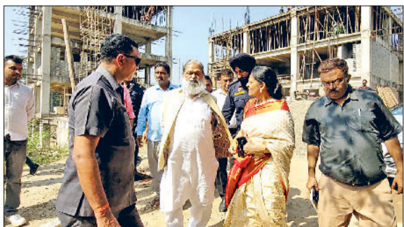
अंबाला। नई बिल्डिंग के निर्माण का मुआयना करते मंत्री अनिल विज।

काम भी शुरू होगा। अभी इसका दौरान मंत्री अनिल विज ने कार्य टेंडर लेवल है। निरीक्षण के दौरान मंत्री अनिल विज ने पीडब्ल्यूडी अधिकारियों से निर्माण