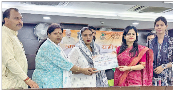
पानीपत। स्वच्छ हुई ग्राम पंचायतों के सरपंचों को सम्मानित करते हुए अधिकारीगण।