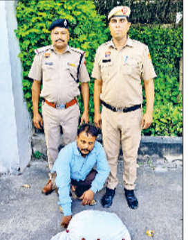
आरोपी के कब्जे से 3 किलो 800 ग्राम गांजा जब्त किया है। पूछताछ के लिए पुलिस ने आरोपी को छह