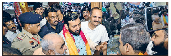
करनाल। जीएसटी में छूट पर मुख्यमंत्री का स्वागत करते दुकानदार।

हरिभूमि न्यूज़ करनाल हरियाणा के मुख्यमंत्री नायब सिंह सैनी बुधवार को करनाल के नेहरू प्लेस पहुंचे और यहां दुकानदारों से सीधे संवाद किया। दुकानदारों ने फूल बरसाकर उनका गर्मजोशी से स्वागत किया और जीएसटी में दी गई छूट को ऐतिहासिक बताते हुए