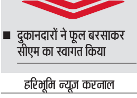
दुकानदारों ने फूल बरसाकर सीएम का स्वागत किया

हरिभूमि न्यूज़ करनाल हरियाणा के मुख्यमंत्री नायब सिंह सैनी बुधवार को करनाल के नेहरू प्लेस पहुंचे और यहां दुकानदारों से सीधे संवाद किया। दुकानदारों ने फूल बरसाकर उनका गर्मजोशी से स्वागत किया और जीएसटी में दी गई छूट को ऐतिहासिक बताते हुए