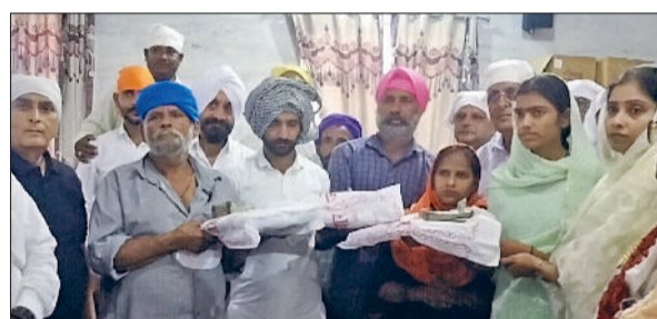
पानीपत। डेरा बाबा जोध सचियार ने पंजाब के बाढ़ पीड़ितों को नगदी भेंट करते हुए सेवादर।