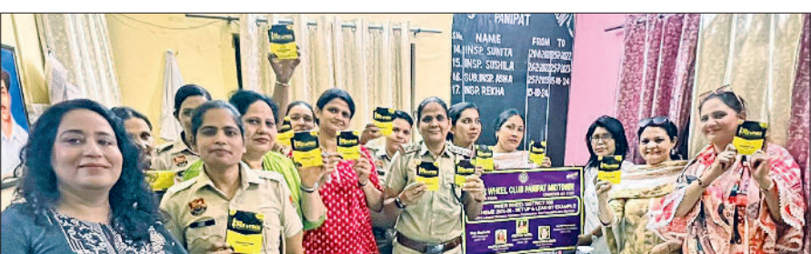
पानीपत। इन्टर व्हील क्लब की टीम महिला थाना में पी फनल बांटते हुए।

इन्टर व्हील क्लब पानीपत मिड टाउन द्वारा जिले से प्राप्त पी फनल प्रोजेक्ट के तहत महिला सशक्तिकरण और स्वच्छता को बढ़ावा देने के उद्देश्य से विशेष पहल की गई। इस अंतर्गत क्लब ने महिला थाने तथा रेलवे स्टेशन की