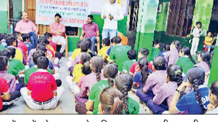
घरौड़ा। निजी हाईस्कूल में छात्रों को स्वच्छता के प्रति जागरूक करती नपा की

हरियाणा शहर स्वच्छता अभियान 2025 के तहत नगर पालिका घरौड़ा ने एक विशेष स्वच्छता अभियान चलाया जा रहा है जो पूरे शहर में 24 नवम्बर तक चलाया जाएगा। स्वच्छता टीम द्वारा बुधवार को घरौड़ा बाजार में स्थित निजी हाई स्कूल में नगर पालिका स्वच्छता टीम द्वारा जागरूकता अभियान चलाया गया।